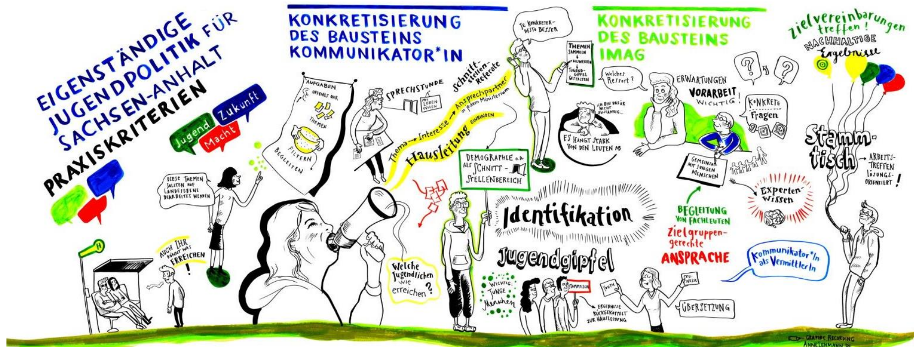
Graphic Recording des 3. Moduls